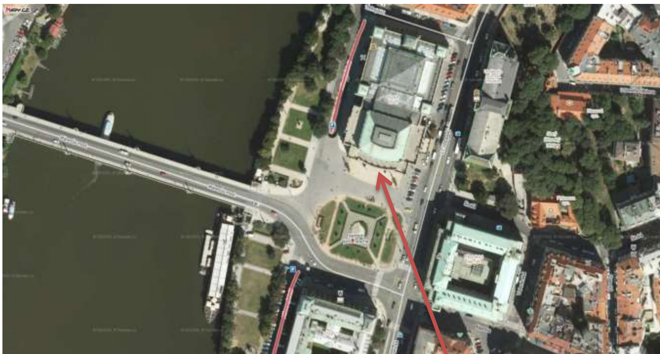
Vstup do budovy Rudolfina